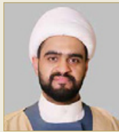
الشيخ ميثاب الدغاس