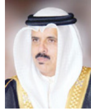
وزير التربية والتعليم

كشف وزير التربية والتعليم الدكتور ماجد النعيمة عن أنه ضمن توجه الوزارة المستمر لتطوير وتحديث المناهج الدراسية، لمواكبة آخر التطورات المحلية والإقليمية والعالمية، تعزيزاً لجودة مخرجات جميع المراحل الدراسية، فإنه سيتم في العام الدراسي المقبل 2022/2021، إدراج موضوعات عن الذكاء الاصطناعي في مناهج التصميم التقني للصفين الثاني والثالث الابتدائي، وإضافة موضوعات عن الاقتصاد الرقمي في مناهج العلوم التجارية بالمرحلة الثانوية.