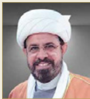
الشيخ مجيد العصفور